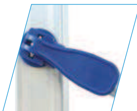
Montantes laterales con sistema FAST de posicionamiento. Montants latéraux avec système FAST de positionnement.