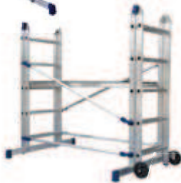
Fácil desplazamiento. Déplacement facile.