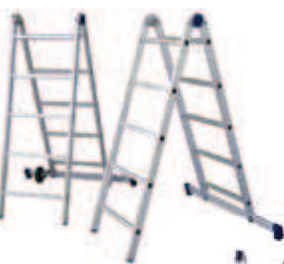
2 escaleras dobles. 2 échelles doubles.