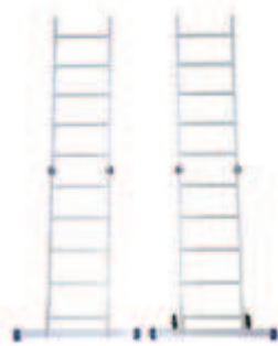
2 escaleras simples de apoyo. 2 échelles simples.

FR Construit avec des montants en aluminium de 60x24 mm. et des échelons antidérapants striés, sertis. Articulations automatiques en fonte d'aluminium. Montants latéraux avec un système rapide de positionnement. Plateforme en aluminium et plancher phénolique de 143x51 cm. Montage très rapide : 4', la deuxième fois. Conçu pour supporter 150 kg.