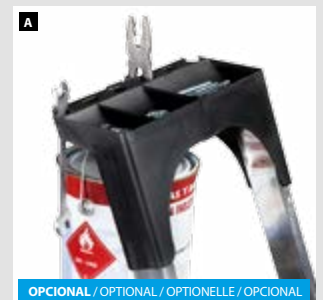
OPCIONAL / OPTIONAL / OPTIONELLE / OPCIONAL