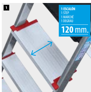
1 ESCALÓN 1 STEP 1 MARCHÉ 1 DEGRAU 120 mm.